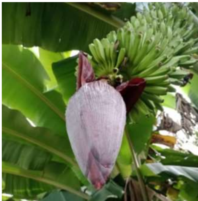
Figura 2. Inflorescência do cacho, coração da bananeira.

Trata-se também de uma pesquisa cujo foco foi investigar o potencial da inflorescência do cacho da bananeira, popularmente conhecida como “coração” da bananeira (Figura 2), como ingrediente alternativo para a formulação de rações destinadas ao tambaqui. O estudo permitiu a descrição de critérios técnicos essenciais que devem ser considerados antes da elaboração de dietas, tais como: hábito alimentar da espécie, sistema de criação, fase de desenvolvimento, composição nutricional, digestibilidade, palatabilidade, disponibilidade ao longo do ano e economicidade. Por fim, a análise dos dados foi realizada de forma descritiva, com base em informações obtidas em campo e na literatura científica.