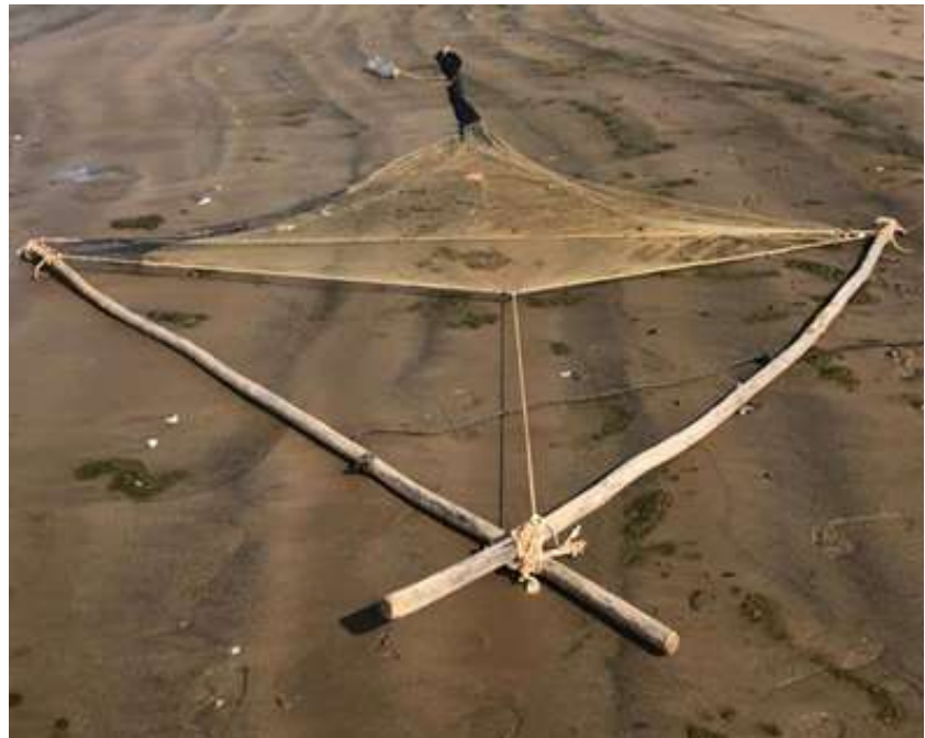
Figura 3. Disposição dos cabos de amarração no puçá de camarão, demonstrando a estrutura em X das varas e a fixação da rede para a operação de pesca.

Esta configuração permite que o puçá mantenha sua forma e eficácia durante a operação de pesca, otimizando a captura de camarões nas condições específicas da região costeira de Anchieta.