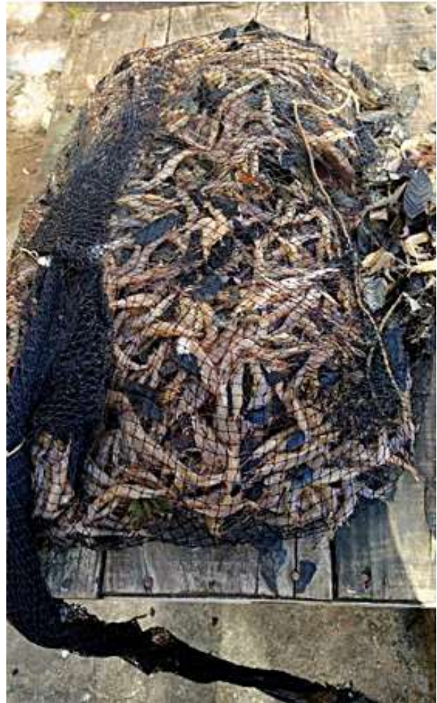
Figura 4. Resultado da pesca com puçá, evidenciando o volume de camarões capturados no saco da rede, juntamente com outros materiais.

Quanto à produção, o apetrecho tem capacidade para aproximadamente 10 kg de material no saco da rede, incluindo camarões, fauna acompanhante, resíduos sólidos e vegetais. A produtividade varia conforme o tempo de arrasto e a disponibilidade de recursos. Além dos camarões-alvo, foram observados outros organismos como peixes, moluscos, cnidários e crustáceos, incluindo o siri-azul, evidenciando o impacto do apetrecho na biodiversidade local (Figura 4).