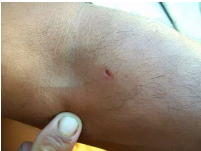
Figura 3. Perfuração no braço de um pescador causada por um bagre enquanto manuseava pescados a bordo da embarcação.